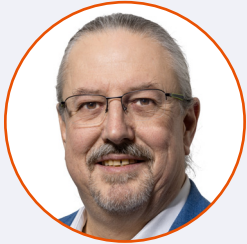
Beat Flach Nationalrat glp (AG) und Initiativkomiteemitglied

«Zentral ist, dass die Regeln wirksam sind und Menschenrechtsverletzungen und Umweltzerstörung verhindert werden. Dabei muss auch der Hochrisikosektor Rohstoffhandel berücksichtigt werden.»