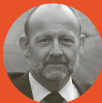
Dominique de Buman Ancien conseiller national Le Centre