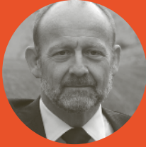
Dominique de Buman Alt-Nationalrat Die Mitte