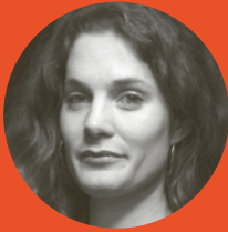
Silva Lieberherr Multiwatch