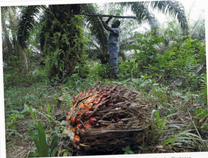
Die Schatten des Palmöls: Aktivistinnen und Aktivisten kritisieren, sie seien den Plantagen-Betreibern ausgeliefert.