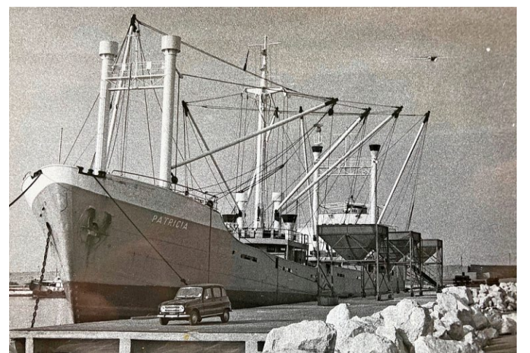
Mit geliehenem Geld gekauft: Das erste Schiff der MSC-Flotte, getauft auf den Namen Patricia, im Jahr 1970.